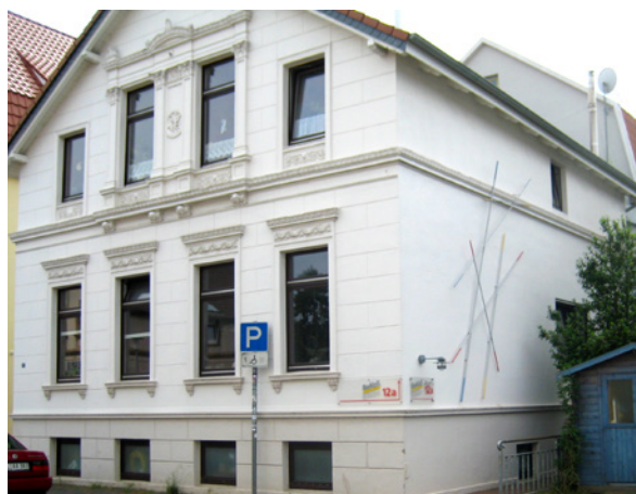
Das Haus der BeKoS, in dem die Angebote der Alzheimer Gesellschaft stattfinden