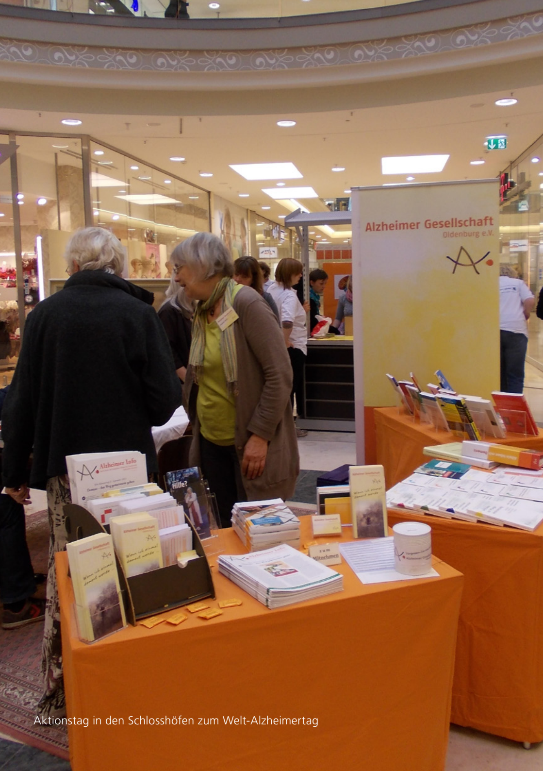
Aktionstag in den Schlosshöfen zum Welt-Alzheimerstag